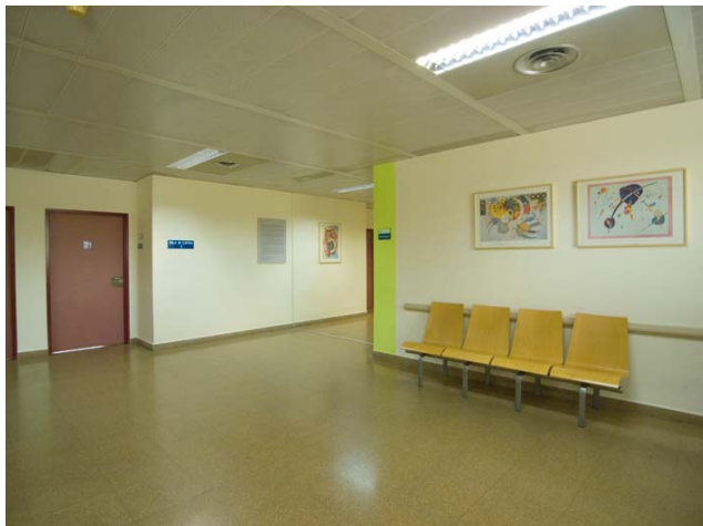
Hospitables 2. Hospital Universitario Fundación Alcorcón. Primera Planta ala derecha. Sala de espera 3. Detalle Bauhaus. (Kandinsky)

La conclusión es que si el arte es beneficioso para el desarrollo del individuo en condiciones óptimas de salud, con más motivo lo será para aquellos que sufren un déficit de la misma y por lo tanto se encuentran más vulnerables a los efectos externos. Si bien no todo tipo de arte es bienvenido a este tipo de espacios lo interesante es trabajar en equipo e indagar el potencial que los ambientes favorables tienen sobre el aspecto curativo.