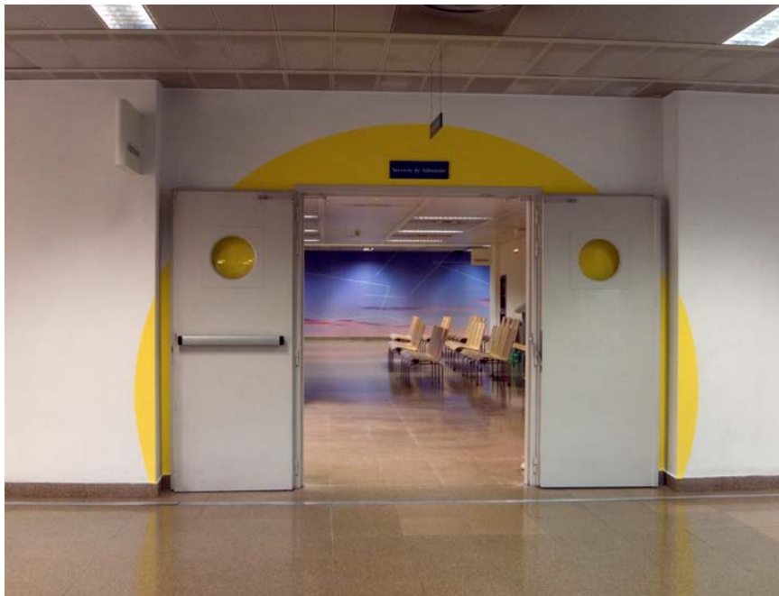
Hospitables 2 . Hospital Universitario Fundación Alcorcón. Sala de Admisión

En hospitables 2 la actuación se centró en las consultas externas del Hospital Universitario Fundación Alcorcón. Madrid. Parte de la problemática a tratar era la dispersión de las consultas externas en el entramado arquitectónico del hospital, debido al crecimiento de las mismas en los últimos años, y la dificultad de los pacientes para localizarlas. El proyecto artístico que diseñé tenía como respuesta ayudar a identificar de forma rápida y sencilla dichas consultas. Por un lado con una identidad externa a través de unas formas circulares amarillas y por otro con una identidad en su interior definida por un tono específico del color verde.