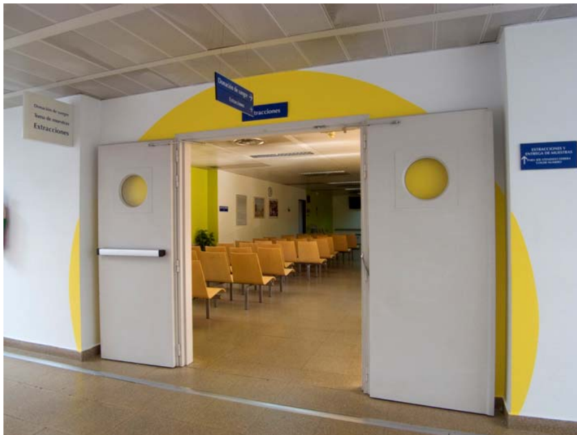
Hospitables 2. Hospital Universitario Fundación Alcorcón. Extracciones

En la actuación espacial tuve muy en cuenta el diseño y concepto arquitectónico del edificio concebido como hospital-ciudad, para sumar el proyecto sin que chocase con lo existente y para que fuese un proyecto flexible en el tiempo, pensando en el crecimiento futuro de este tipo de instituciones.