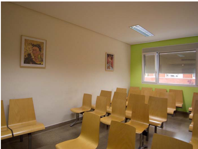
Hospitables 2. Hospital Universitario Fundación Alcorcón. Segunda Planta. Sala de espera. Ginecología. Detalle Autoretrato de Frida Khalo. Maternidad de Tamara de Lempicka