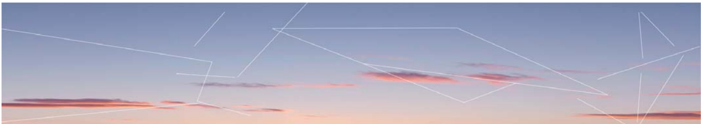
Multiversos sincronizados 1. Amanecer 2012. Fotografía. Impresión digital sobre tela. 14,5 x 2,52 mtr. Localización: Admisión.

Hospitables 2. Hospital Universitario Fundación Alcorcón