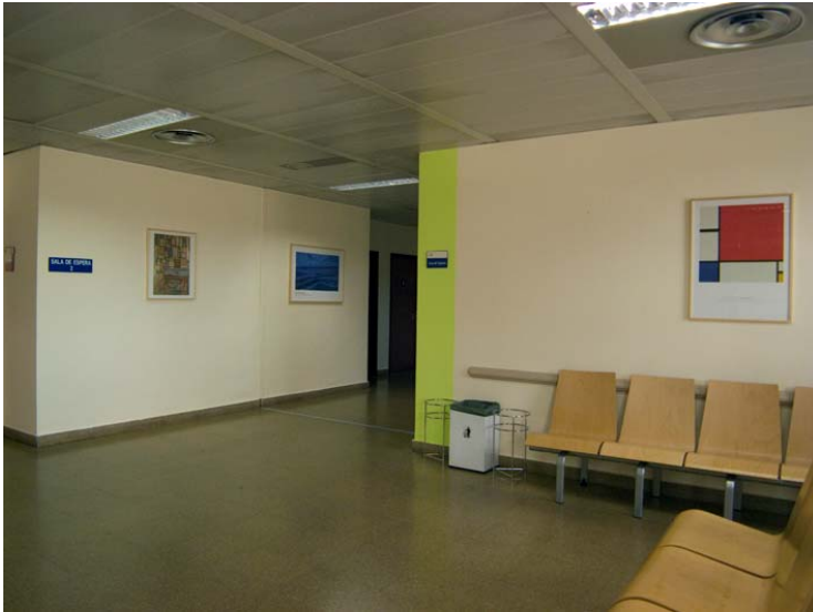
Hospitables 2. Hospital Universitario Fundación Alcorcón. Segunda Planta ala derecha. Sala de espera 2. Detalle Neoplasticismo. (Mondrian)

HOSPITABLES. © Noni Lazaga. 2009-12. HOSPITABLES. © Noni Lazaga. 2009-12.