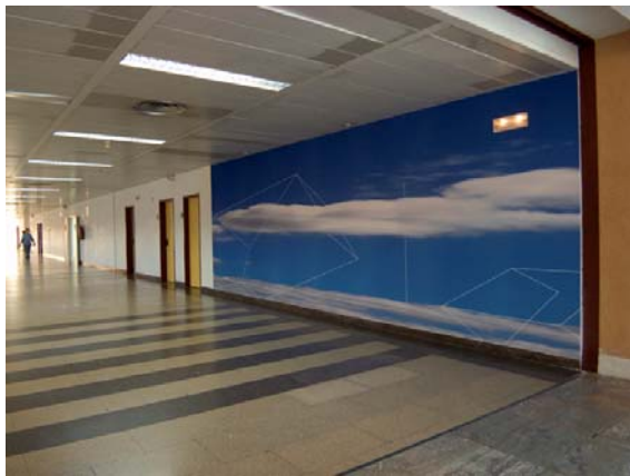
Vista del pasillo central. Planta baja.

La tercera parte de la actuación tenía por objeto reciclar el material que aparecía como "decorativo" (láminas) introduciendo el concepto cultural en el interior de las consultas. Una vez examinadas las láminas de arte existentes